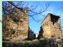
1. Portal de Solsdevila - Inici