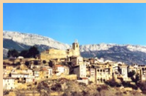
3. Vista sud de la vila