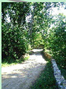
4. Pont d'en Rosell - Final