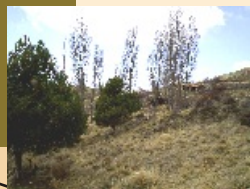
3. Font de Gabrieló

Recorregut de llarga durada per la primera graonada del Montsec. Gaudirem d'una panoràmica magnífica de la vall i d'un paisatge espectacular de bosc mediterrani d'alzines i pins, passant per l'ermita de Pedra dels segles XI i XVI i el santuari-refugi de Colobor del segle XVI. A peu. També en cotxe, cavall i btt fins a Pedra o a cavall i en btt per la ruta Àger-Pedra-Sender dels Petrolers-Àger.