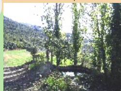
Font de Gomà