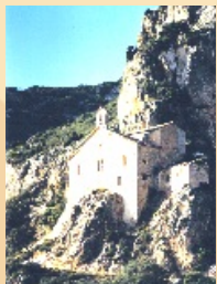
2. Mare de Déu de Pedra