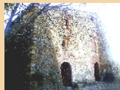
5. Mare de Déu de Colobor