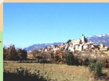
1-6. Àger. Inici - Final