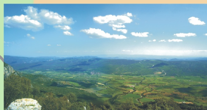
La vall d'Ager