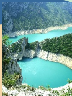
Congost de Fet