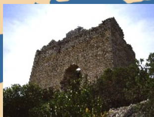
3. Torre de les Conclues - Final