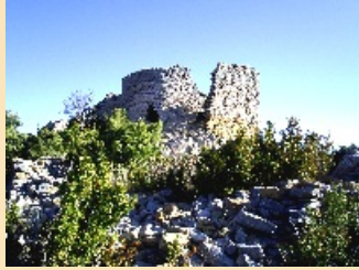
5. Castell de St. Llorenç - Final

La ruta comença amb un primer tram d'ascens entre vegetació mediterrània i les vistes de Corçà. Al barranc de la Pardina, podem apreciar-hi la flora pròpia de les zones d'obaga. Acabarem al castell de St. Llorenç, recinte fortificat del segle XI, i les restes de l'antic poblat; aquí gaudirem d'una panoràmica esplèndida del congost de Seguer i de tota la vall. A peu, els atrevits també a cavall.