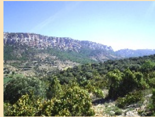
4. Altura màxima