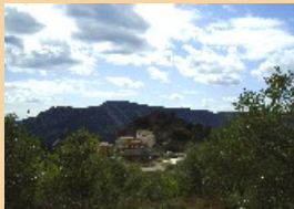
1. Corçà - Inici